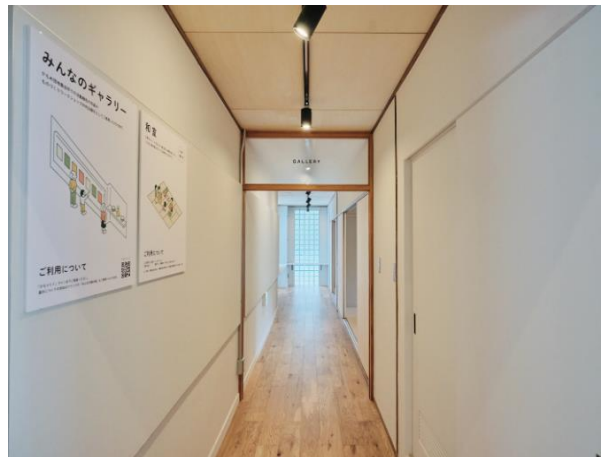
みんなのギャラリー