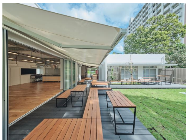
つながるストリートファニチャー